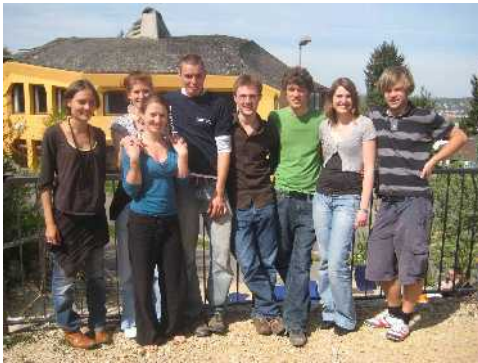
Organisation de jeunesse IDEM

IDEM – Identité par initiative est une initiative de jeunesse. Ce réseau de projets fut fondé par des jeunes en Allemagne et en Suisse. En janvier 2005 il fut enregistré comme « Société de Utilité Publique ». Le but de IDEM est de supporter les jeunes de prendre l'initiative et de leur permettre d'agir en toute autonomie. Les projets de IDEM montrent qu'ils sont propices au développement de la personnalité des jeunes et leur permettent de trouver aussi bien leur identité personnelle au sein de la société.