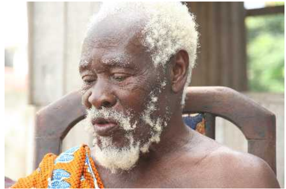
Frédéric Bruly Bouabré

Frédéric Bruly Bouabré (*1923) est devenu très connu en Europe et dans tout le monde par de grandes expositions – surtout en Allemagne par la « documenta 2002 » et aussi par son art et ses efforts pour conserver et évoluer la culture africaine. Il est d'autre part le créateur d'un alphabet ouest-africain. Tandis que longtemps il a été peu considéré et soutenu dans son pays. Son œuvre reflète sa vision de la nécessité d'une fécondation réciproque des cultures ouest-européenne et africaine