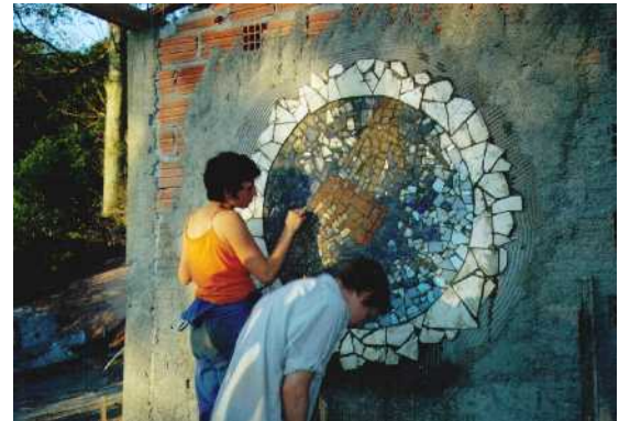
Chantier de jeunesse d' IDEM au Brésil 2005

interculturelles et des études globales. A cet effet on organise des work-camps et des projets internationaux. Dans les écoles et des stages IDEM encourage « la conscience de la responsabilité au niveau global » et inaugure des champs d'actions qui sont ouverts à tous. IDEM soutient, accompagne et émet des impulsions.