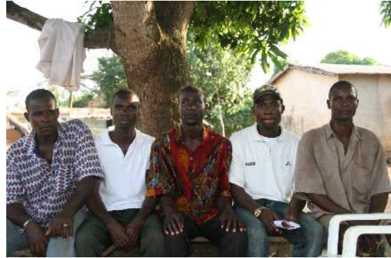
Organisation de jeunesse JUDEZ.

JUDEZ (Jeunesse Unie pour le Développement de Zépréguhé) est une organisation d'entraide par des jeunes dans le village de Zépréguhé, le village natal de Bruly Bouabré. Les adolescents se rencontrent régulièrement pour parler des problèmes du village et pour les résoudre par une aide pratique.