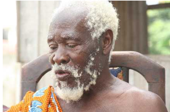
Frédéric Bruly Bouabré

Frédéric Bruly Bouabré (*1923) ist durch seine Kunst und seine Bemühungen für einen Erhalt und die Weiterentwicklung der afrikanischen Kultur (u.a. ist er der Schöpfer eines westafrikanischen Alphabetes) in Europa und der ganzen Welt durch zahllose große Ausstellungen (in Deutschland zuletzt 2002 auf der documenta) bekannt geworden, während er in seiner Heimat lange wenig beachtet und gefördert wurde. Sein künstlerisches Werk spiegelt seine Vision von der Notwendigkeit einer gegenseitigen Befruchtung der europäischen/westlichen und der afrikanischen Kultur.