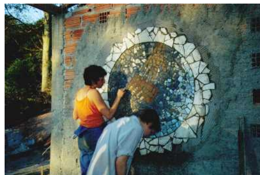
IDEM-Workcamp Brasilien 2005

Vom 13. Juli bis 2. August 2008 werden in Zépréguhé etwa 20 junge Menschen aus Europa und der Elfenbeinküste zusammen treffen. Vormittags ist gemeinsame praktische Arbeit an der Errichtung des „Centre d'actions culturelles Bruly Bouabré“ geplant. Nachmittags soll Zeit sein für vielfältige kulturelle Begegnungen. Die jungen Europäer möchten die afrikanische Kultur und Lebensweise kennen lernen, die Ivorer mehr von Europa erfahren. Diesem Austausch soll in Gesprächen, gemeinsamer künstlerischer Tätigkeit, Ausflügen und Aktionen und in Begegnungen mit den Künstlern Raum gegeben werden.