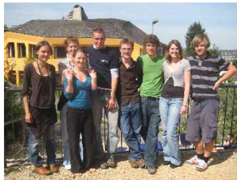
Vorbereitergruppe von IDEM

IDEM fördert lokale Aktionen, interkulturelle Begegnung und globales Lernen. Zu diesem Zwecke werden Workcamps und länderübergreifende Projekte durchgeführt. In Schulen und auf Jugend- und Schülertagungen arbeitet IDEM an den Themen „Bewusstsein für Verantwortung im globalen Zusammenhang“ und dem Aufzeigen und Eröffnen von Aktionsfeldern, die Einzelnen offen stehen. IDEM unterstützt, begleitet und setzt Impulse.